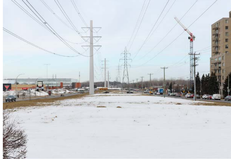
Boulevard Cavendish dans l'arrondissement de Saint-Laurent : Ligne actuelle (à gauche) et simulation visuelle de la future ligne (à droite).